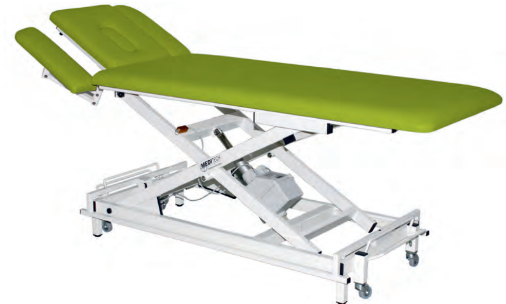
Abbildung enthält Sonderausstattung (Jubiläumspaket Therapie 25)